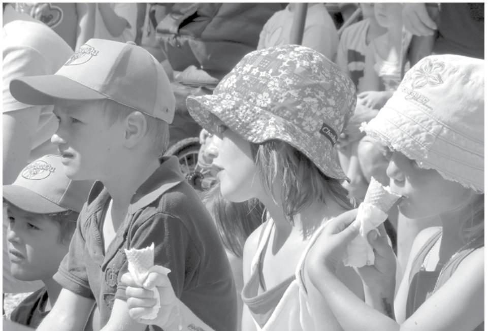
Gespanntes Zuhören am Kinderland Openair

Spiele, die die Bewegung der Kinder fördern. Gemeinsam mit den Sponsoren sucht der Veranstalter immer neue, sinnvolle Spiel- und Erlebnisformen.