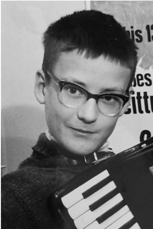
1963 im Handorgelclub. Ein mal pro Woche kam ein Lehrer von St.Gallen zum Unterrichten.