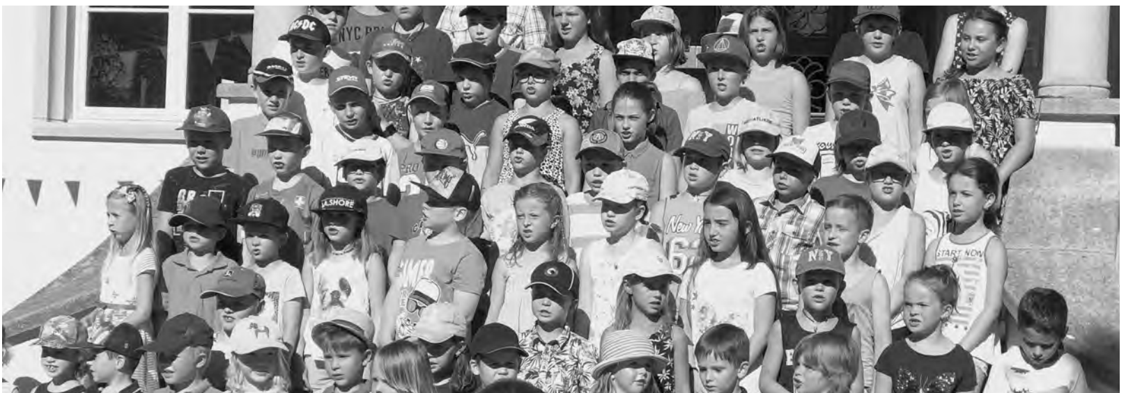
Schulschluss-Fest im Schulhaus Kenzenau