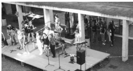
Konzert der Schülerband