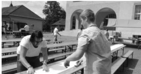
Vorbereitung am Nachmittag