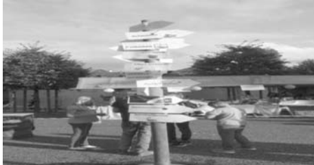
Wo findet man....