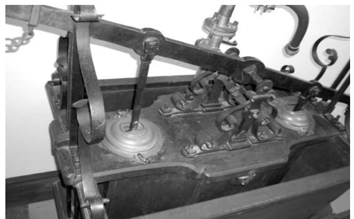
Die ältesten Teile der Handspritze